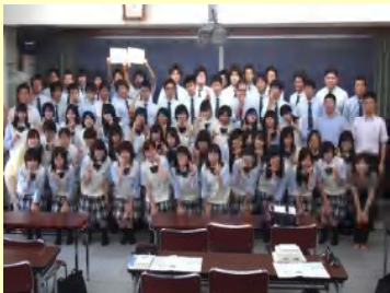
最終日に全員で記念撮影。達成感に溢れた表情が印象的でした。