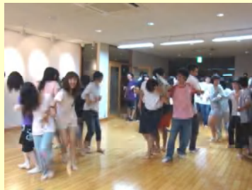
レクリエーションでは、体を動かし、仲間との絆を深めました。