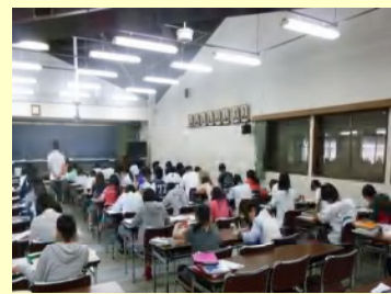
自習に励む生徒達の様子です。皆、熱心に取り組んでいます。