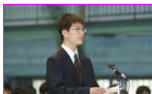
力強く新入生の宣誓をしました！